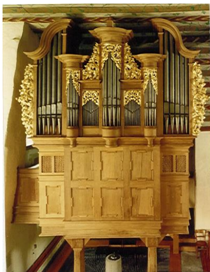
Rhaunen (ev. 1723)

An folgenden STUMM-Orgeln soll dabei unterrichtet werden: